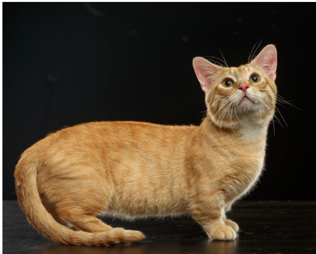
Munchkin-Katze mit angezüchteten Stummelbeinen.