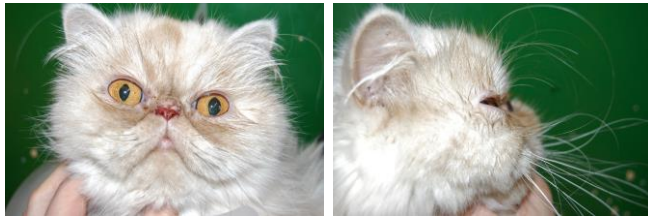
Peke-face Perserkatze mit dem typischen platten Gesicht.

„ Tränenspuren “ neben der Nase, da wegen der Verkrümmung des Schädels nach innen die Tränen nicht abfließen können und am Unterlid überlaufen.